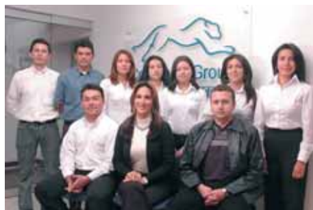
Teammitglieder CCG Bogota