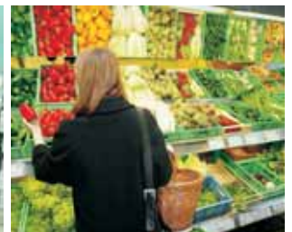
Verkauf im Supermarkt