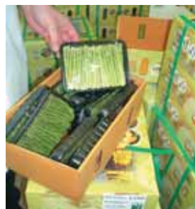
Feiner grüner Spargel