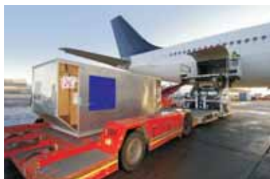
Frachtladung am Flughafen