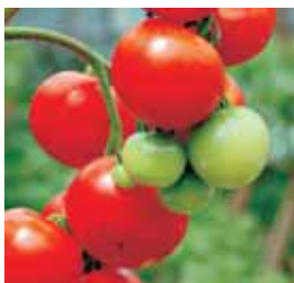
Tomaten vor der Ernte

Unser weltweites Serviceangebot umfasst hauptsächlich: Luftfracht, Seefracht, Trucking und “to door“-Distribution, Import / Export inklusive Zollabwicklung, Qualitätsprüfung, Warenkonsolidierung, Lagerung / Kühlhaus.