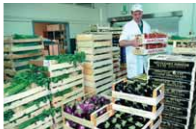
Zwischenlager im Kühlhaus