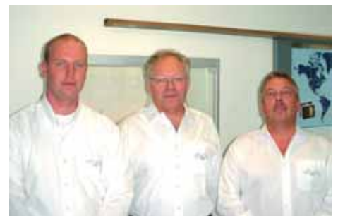
Import-Team CCG Amsterdam