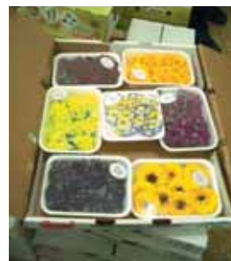
Essbarer „Verzehrb Blüten“