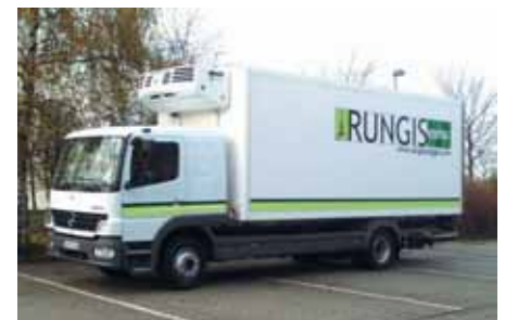
LKW aus der modernen Rungis-Flotte